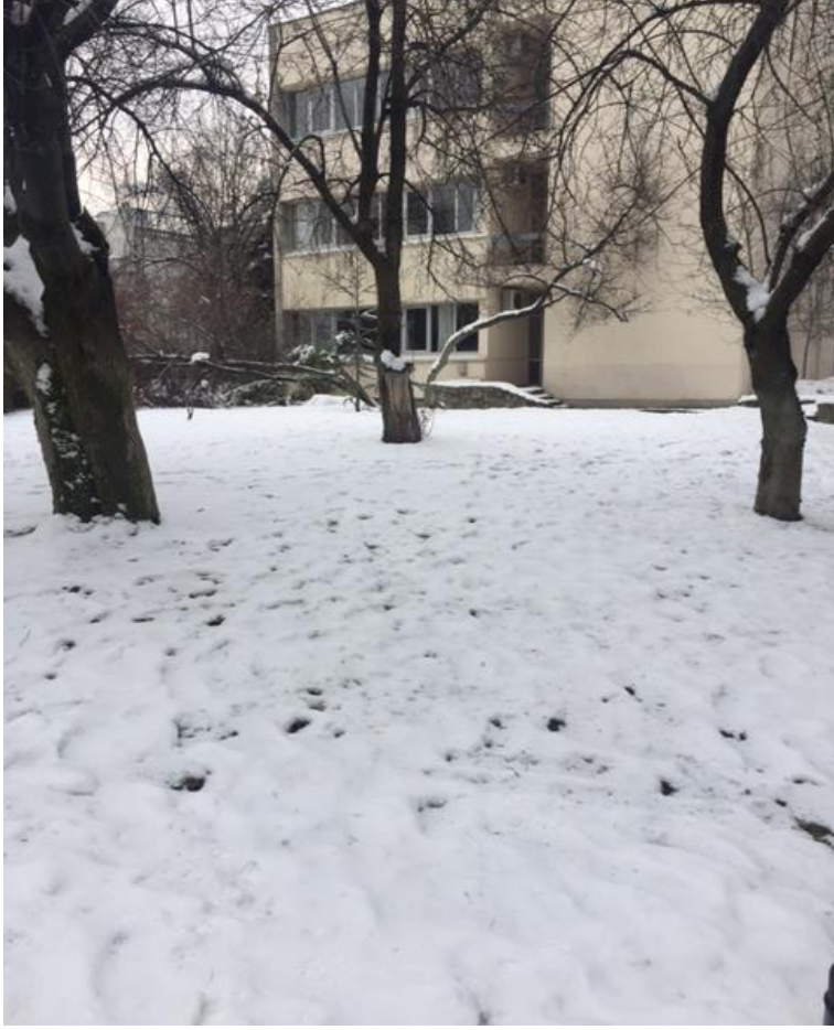
Şekil 6- Anıtın konumlanacağı alan