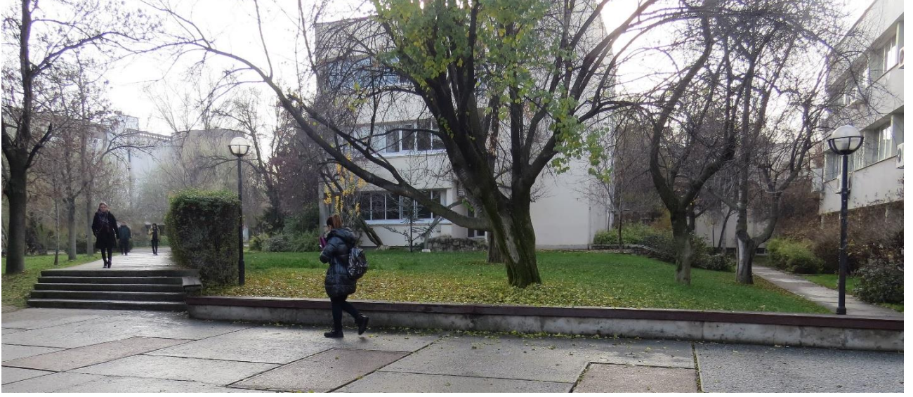
Şekil 3- Anıtın konumlanacağı alan (Çalı ve banklarla sınırlanan yarışma alanı)