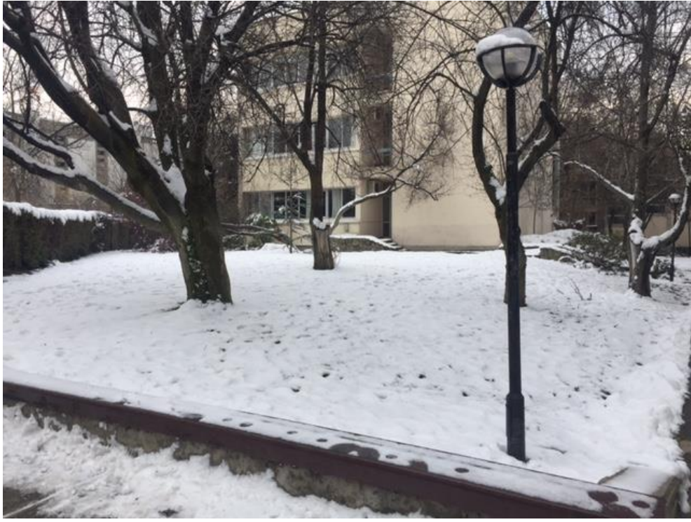
Şekil 4- Anıtın konumlanacağı alan