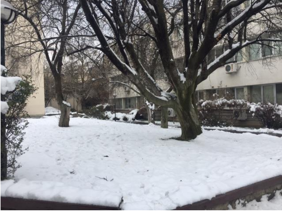
Şekil 5- Anıtın konumlanacağı alan